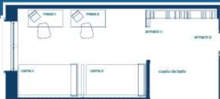
Planos tipo, puede haber variación en la situación del mobiliario.